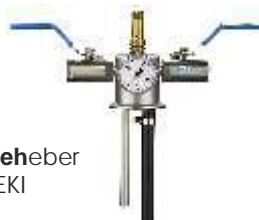
Entnahmeheber Typ EKI