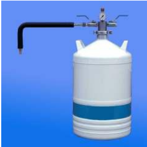
ALU 26 mit EKI-Entnahmeheber und Entnahmerohr