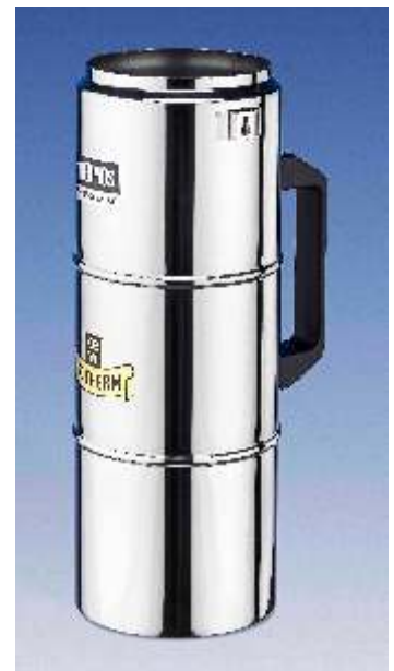
Dewargefäß Typ GSS