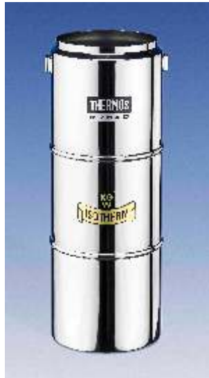
Dewargefäß Typ DSS